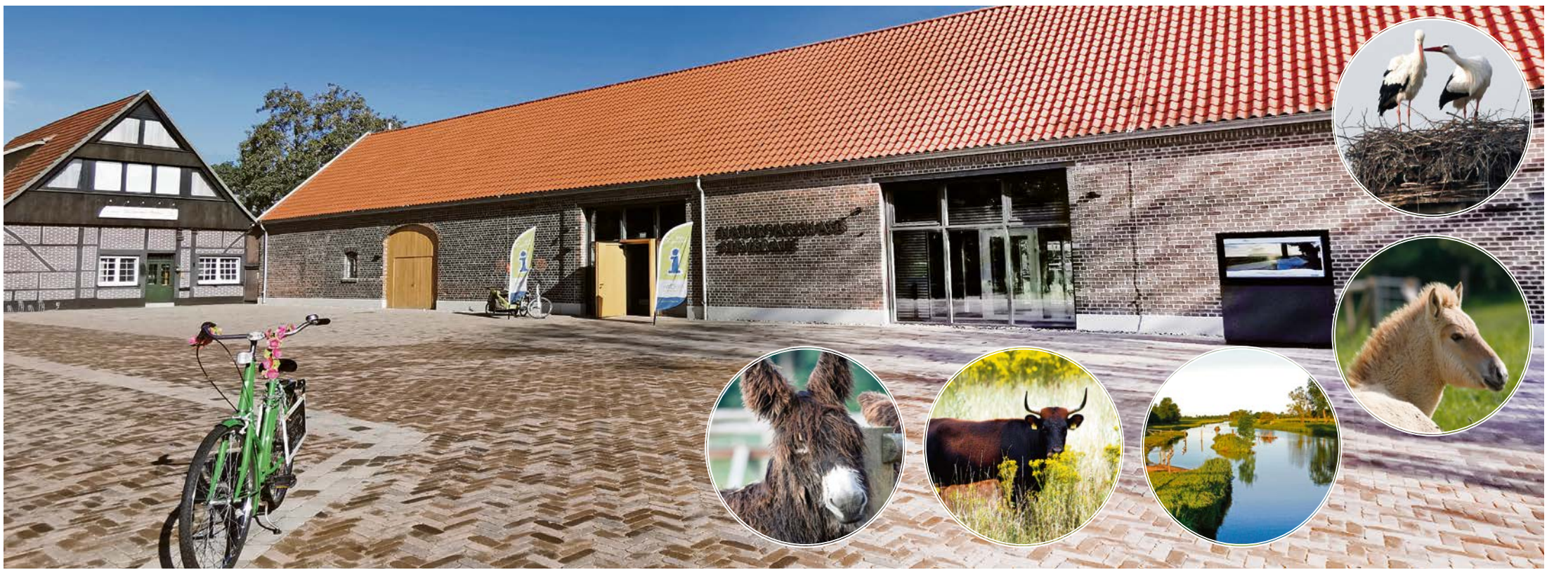
Das Naturparkhaus in Olfen ist nun auch im Innenbereich fast fertiggestellt. Ab dem 20. Mai können sich alle Besucher im Erlebnissbereich nicht nur informieren, sondern die Steveraeue interaktiv erleben.