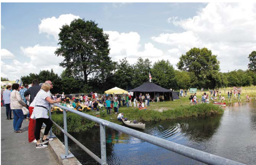
Die Stadt Olfen lädt am 4. Juni zum Steverauenfest mit großem Programm ein.

Der Heimatverein, der Kunst- und Kulturverein, der SuS-Radlertreff, die Imkerei Rosenfeld, die Rollende Waldschule von der Kreisjägerschaft Coesfeld, das Infomobil Naturpark Hohe Mark Westmünsterland, der Info-Truck der FH-Münster zum Thema „Mir schmeckt's – Ernährung erfahren“, das Biologische Zentrum Lüdinghausen, das Naturschutzzentrum Kreis Coesfeld e. V., der Biohof Mehring, die Anbaugemeinschaft SoLaWi, Vertreter der Stever-Land-Route und natürlich die Stadt Olfen selbst mit vielen Infos zur Steverstadt, Freizeitangeboten und einem Gewinnspiel.