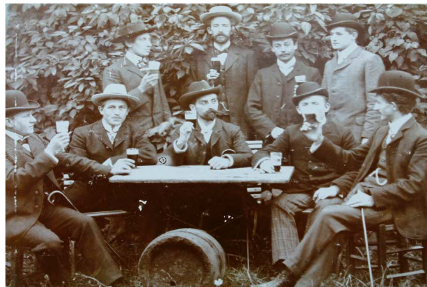
Viele historische Fotos gehören zum Buch „Olfener Bier- und Kneipengeschichten“.