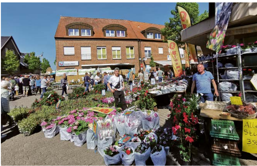
Blumen aus Holland gehören auch in diesem Jahr zum Angebot des Olfener Frühlingsfestes.

Der Werbering Treffpunkt Olfen bietet im Rahmen des Frühlingsfests einen kostenlosen Familien-Flohmarkt auf der Kirchstraße für Privatverkäufer an. Es können bis zu vier Meter Straßenfläche für einen Verkaufsstand belegt werden. Dazu ist eine Anmeldung per Mail an info@werbering-olfen.de erforderlich. Der Flohmarkt findet wie das Frühlingsfest von 11 bis 18 Uhr statt. Der Aufbau ist ab 9 Uhr möglich. Die Fläche wird zugeteilt.