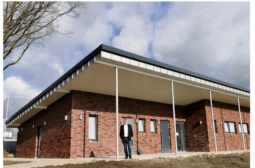
Kunibert Gerij stellt die neuen Umkleideräume für Westfalia Vinnum vor.

Um 15 Uhr sind alle Generationen, Vinnum und auch alle Gäste zu einem Multisportturnier eingeladen, bei dem die beste Mannschaft ermittelt und na-