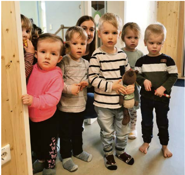
Die Kinder fühlen sich in den neuen Räumen wohl.

Steckdosen vorhanden sind, ist eine weitere Neuerung sofort sichtbar: Vor jedem Gruppenraum hängt ein digitaler Bilderahmen. „Eltern und Kinder sind begeistert, wenn regelmäßig neue Fotos von den Kindern im Kindergartenalltag eingestellt werden“, erzählt Damaris Bartels. Erst auf den zweiten Blick nimmt der Besucher deutlich wahr: Es ist viel leiser als gewohnt: