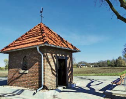
Die Wegekappelle an der Dattelner Straße.