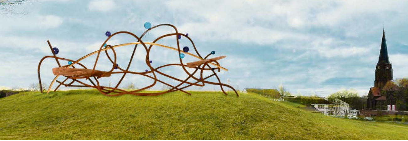
Die Skulptur „The wave“ ist mit den Maßen von 8m x 3m x 3m die größte, die der Künstler bisher schaffen will. Sie wurde eigens für die Stadt Olfen entwickelt und wird unter verschiedenen Aspekten ein optisches Highlight. An der höchsten Stelle der „Alten Fahrt“, wurde von der Stadt Olfen bereits vor etlichen Jahren ein kleiner Hügel aufgeschüttet. Diese Erhebung mit einer Grundfläche von ca. 12 m x 6 m wäre ein natürliches Podest für „The wave“. Die Arbeit selbst interpretiert mit ihren verschlungenen Stäben aus 60 mm x 60 mm Vierkantstahl die Wellen und das sich bewegende Wasser des ursprünglichen Kanals. Farbige Kugeln aus blauem Kunstharz in verschiedenen Größen werden wie überdimensionale Wassertropfen an dem Stahl befestigt. (Quelle und Fotomontage: Konzept Vongries)

sind die Skulpturen von Vongries nicht nur Anschauobjekt, sondern so konzipiert, dass sie erlebt und sogar bespielt werden können.