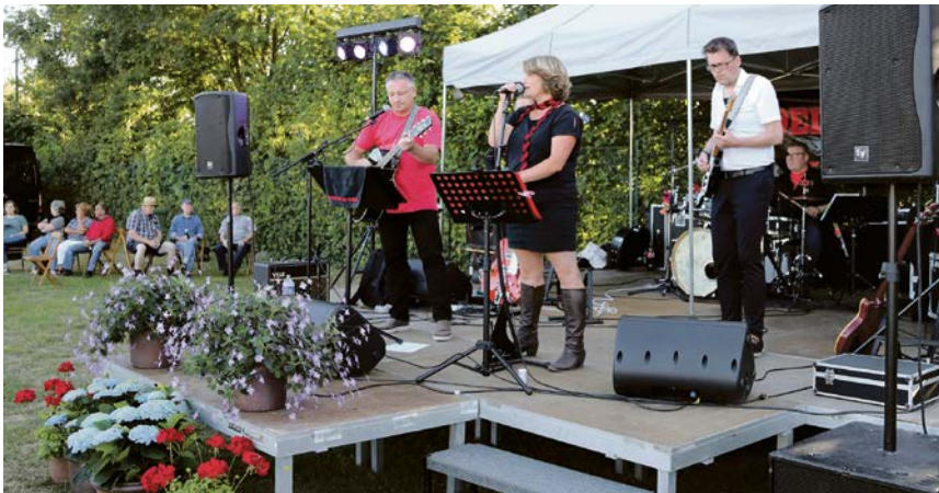
Auch in diesem Jahr richtet die Dorfgemeinschaft Vinnum wieder ein Summer Special aus.

Endlich wird der KITT-Brunnen wieder zu einem ganz besonderen Veranstaltungsort für ein Summer Special.