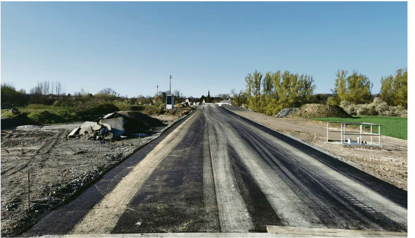
Die Lippebrücke Ahsen sollte am 27. April eröffnet werden. Nun haben Mängel bei den Straßenbauarbeiten zu Verzögerungen geführt.