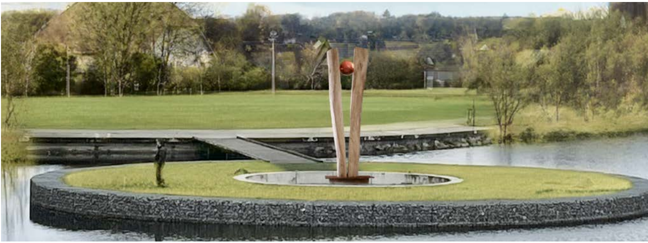
„Orange ball II“ besteht – derzeit nur als Modell – aus zwei halben Eichenstämmen, die senkrecht mit ihrem schmalen Ende auf einem kleinen Stahlpodest fixiert sind. Hierbei sind die flächigen Schnittstellen einander zugewandt. Im oberen Drittel ist zwischen beide Halbstämmen eine orangene Kunstharzkugel mit einem Durchmesser von 30 cm montiert. (Quelle und Fotomontage: Konzept Vongries)

„Durch die Aufstellung eines Kunstwerkes wird der öffentliche Raum anders wahrgenommen als bisher. Es entstehen neue Sichtachsen, Perspektiven und Bezugspunkte. Mitunter ergeben sich auch inhaltliche Verknüpfungen und gestalterische Neuinterpretationen von geografischen Begebenheiten oder kulturhistorischen Ereignissen“, so in Vongries Konzeption zu lesen. Dabei