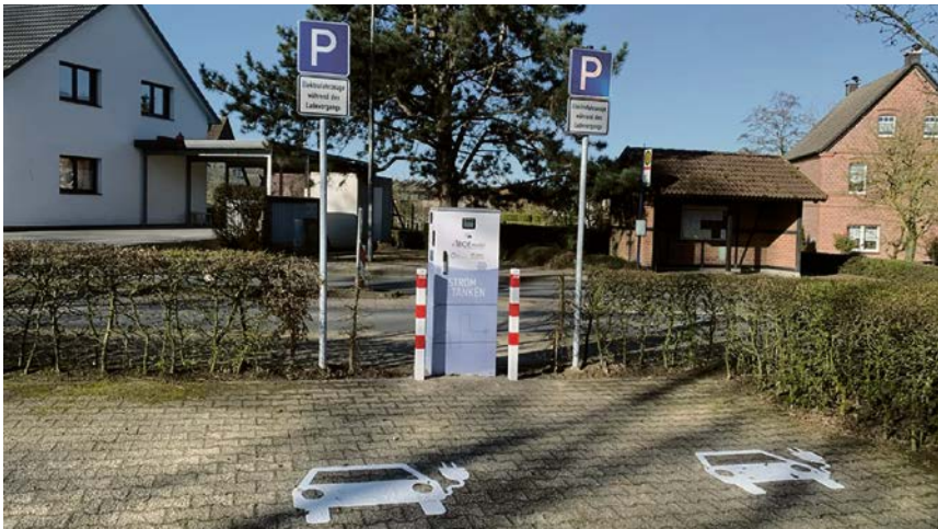
Olfen verfügt jetzt über fünf Ladesäulen. Eine davon an der Hauptstraße in Vinnum.

Die Ausschussmitglieder waren sich einig darüber, dass die zunehmende Bereitschaft vieler Olfener, sich für Stromgewinnung aus Sonnenenergie einzusetzen, sehr zu begrüßen sei. Im Gegenzug Bäume zu fällen, schloss der Ausschuss aber einstimmig aus. Deshalb lautete der Beschluss: Die Verwaltung wird beauftragt, keine Schnittmaßnahmen oder Fällungen an gemeindlichen Straßenbäumen in Auftrag zu geben, die ausschließlich darauf ausgerichtet sind, eine Ertragssteigerung bei privaten Photovoltaikanlagen herbeizuführen.