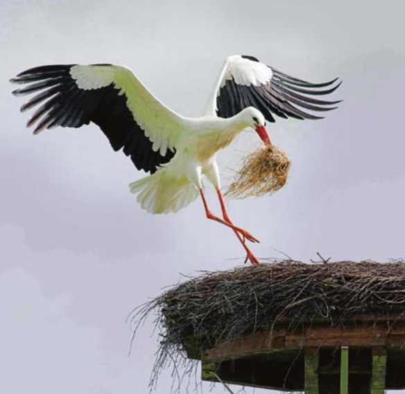
Im Frühjahr diesen Jahres waren mehr Störche in Olfen als Horste zur Verfügung stehen.

Es sei schon faszinierend, wie beliebt die Floßfahrten auf der Stever mit dem besonderen Blick auf die Natur und die Tiere sind. „Hochgerechnet begrüßen