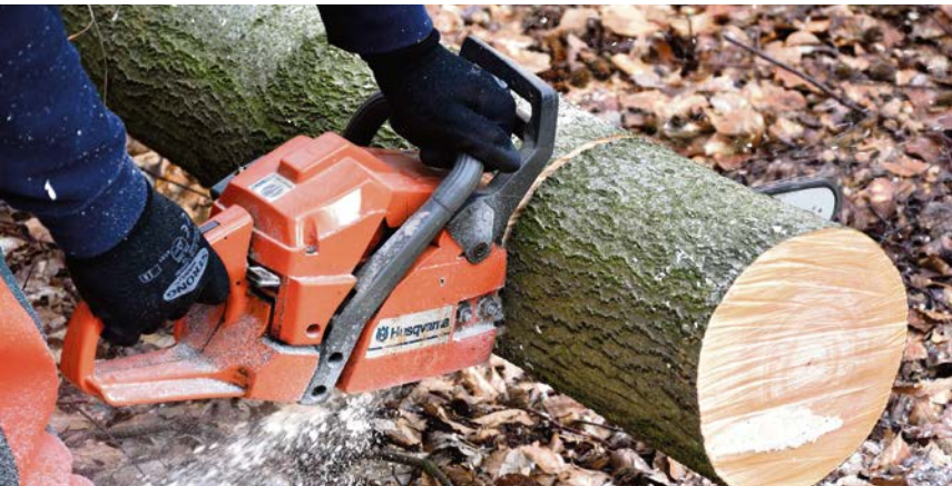
Bäume fällen oder schneiden für Photovoltaik-Ertragssteigerung? Der Ausschuss sagt „Nein“.

„Manchmal muss man sich für eine Seite entscheiden. In diesem Fall haben wir uns eindeutig für den Erhalt von städtischem Grün entschieden.“ Für Bürgermeister Sendermann und die Mitglieder des Bau- und Umweltausschusses stand die Frage im Raum, ob die Gewinnung von Strom mithilfe von Photovoltaikan-