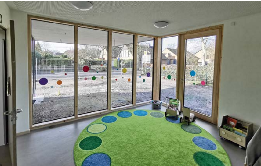
Viel Licht und viel Platz zeichnen die neuen Räume im Kindergarten Arche Noah aus.

Was das neue Gebäude zu bieten hat und was auch für die Umgestaltung des Altraktes noch vorgesehen ist, können sich alle Besucher am 3. Juni von 10 bis 14 Uhr genau anschauen. Dann wird im Rahmen des diesjährigen Sommerfestes die offizielle Einweihung des neuen Kindergartentraktes gefeiert, sowie 23 Jahre Teil der Ev. Kirchengemeinde Olfen.