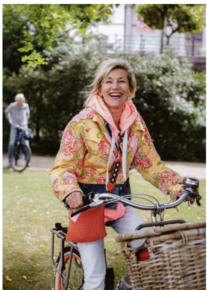
Auch in diesem Jahr nimmt die Stadt Olfen an der Stadtradelkampagne teil.