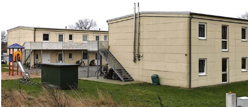
In direkter Nachbarschaft zu den jetzigen Flüchtlingsunterkünften entstehen zwei weitere.

Dies gelte auch für die Grundstücke, die die Grünen vorgeschlagen hätten. Einzig ein Grundstück im Bereich der Gesamtschule sei möglich. Dies wolle die Stadtverwaltung aber für evtl. Schulzwecke weiter vorhalten. Angesichts der steigenden Zahl an Flüchtlingsaufnahmen auch in Olfen und des akuten Platzmangels dränge nun die Zeit. Der Rat der Stadt Olfen beschloss schlussendlich, dem Vorschlag der Verwaltung zu folgen. Hiernach sollen am Vinnum Landweg in direkter Nachbarschaft der bereits bestehenden Flüchtlingsunterkünfte zwei neue Unterkünfte mit insgesamt 118 Plätzen entstehen.