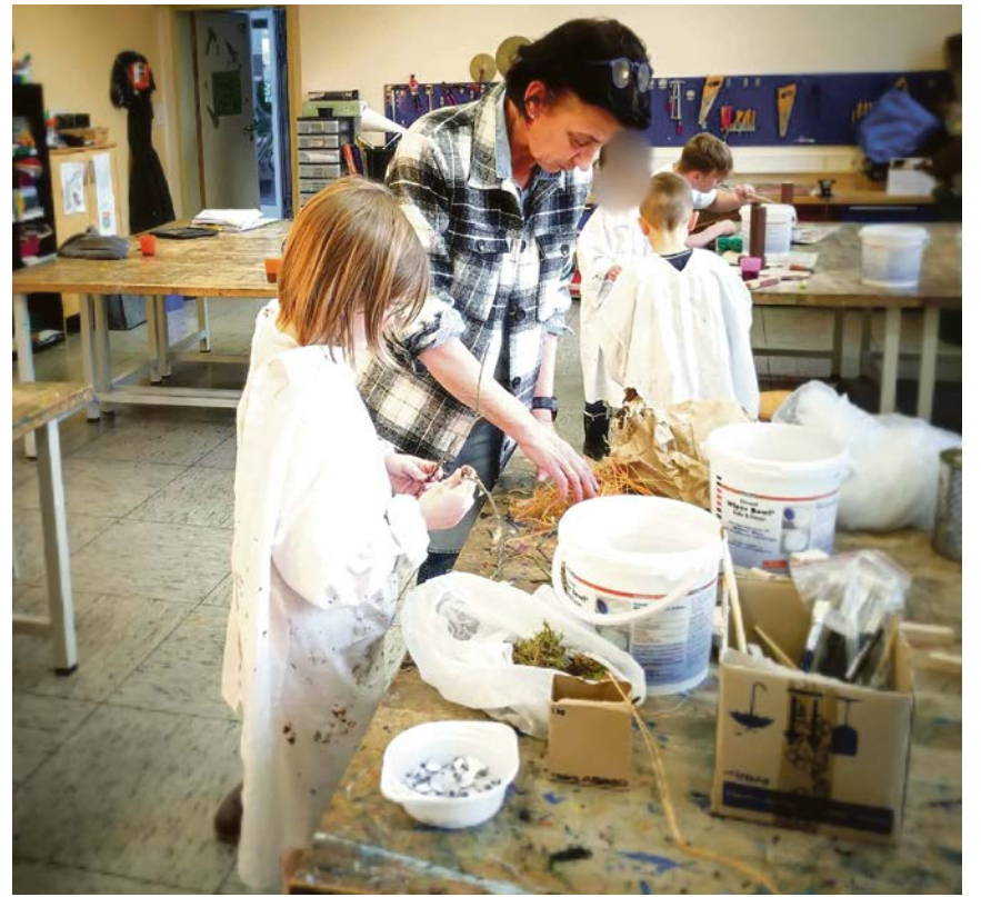
Zu den Angeboten der OGS gehört auch die Teilnahme an verschiedenen AG's.

Mit der Anmeldung zum OGS-Angebot hat das Kind Anspruch auf Teilnahme an den Ferienbetreuungen. Die Stadt Olfen bietet darüber hinaus auch den Familien aus den anderen Betreuungsformen die Möglichkeit, an den Ferienbetreuungen teilzunehmen. Diese werden nach Anmeldung separat abgerechnet.