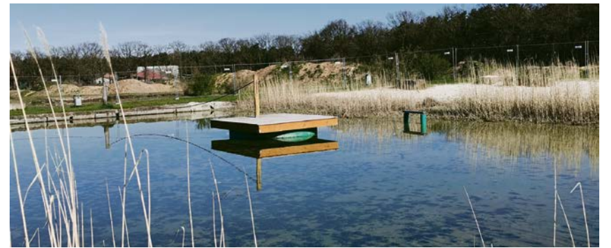
Das marode Schiff inklusive Holzplattform und Wackelbrücke am Naturbad wird ausgetauscht.

Weiterhin werde es ab 2024 jährlich eine Inspektion der Spielplätze geben, wonach dann nach Bedarf weitere Maßnahmen beschlossen werden sollen. „Sobald das Baugebiet „Olfener Heide“ weitgehend bebaut ist, wird