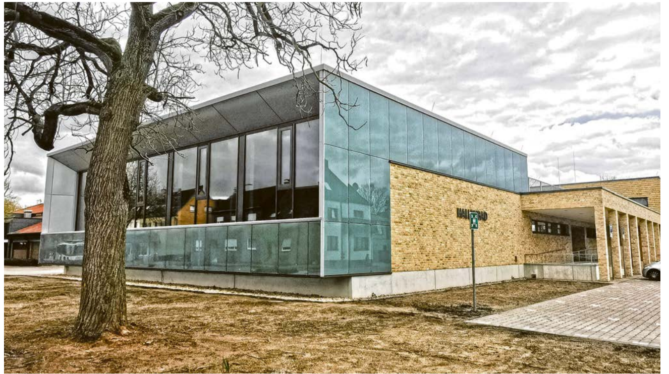
Nach der Geestturnhalle hat jetzt auch das Hallenbad seinen Betrieb gänzlich aufgenommen. Seit dem 13. April kann auch die Öffentlichkeit das neue Bad ausgiebig nutzen.

Start des öffentlichen Schwimmens seit dem 13. April