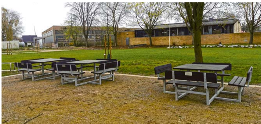
Sitzgruppen gehören zur Ausstattung des neuen Gemeinschaftsplatzes, den die Bürgerschützengilde mit viel Eigenleistung gestaltet hat.

Weitere Informationen unter: buergerschuetzengilde-olfen.de