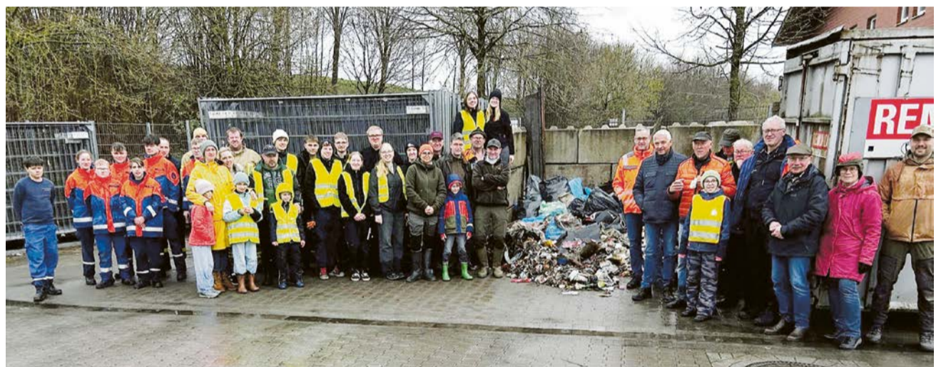
Rund 70 Teilnehmer aus verschiedenen Vereinen beteiligten sich an der diesjährigen Müllsammelaktion.