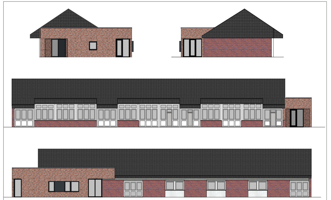
So sehen die Planungen für den Umbau und die Erweiterung des St. Marien-Kindergartens aus. Grafik: Architekturbüro Scholz

Der Kindergarten St. Marien Vinnum hat eine über 50jährige Geschichte. Kaum eine Vinnumerin und ein Vinnumer im entsprechenden Alter, der nicht seine Kindergartenzeit dort verbracht und daran viele Erinnerungen hat.