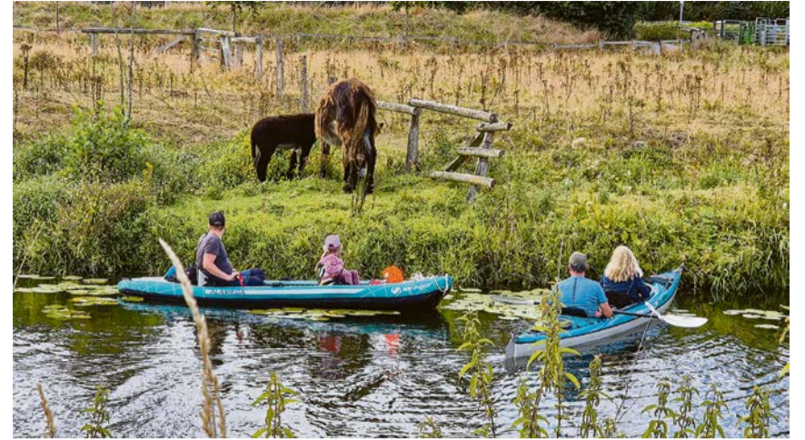
Das Anlanden an und das Betreten der Uferbereiche der Steverauen ist nicht erlaubt, wird aber nicht selten praktiziert.

„Wir können den Umgang privater Wassersportler mit den Vorgaben