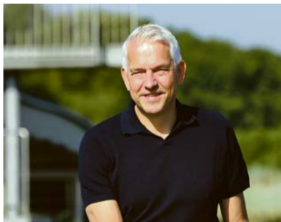
Wilhelm Sendermann

Aktionen wie die Spieltage an jedem 2. Sonntag runden das Angebot ab. Das Naturparkhaus ist von April bis Oktober, mittwochs bis sonntags sowie an Feiertagen von 10 bis 16 Uhr geöffnet.