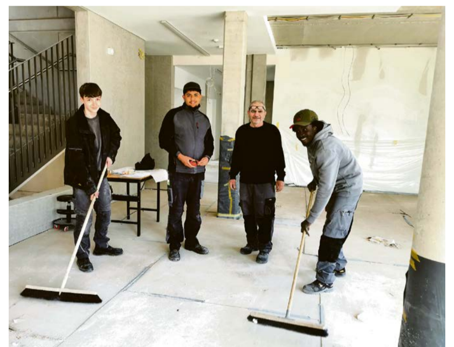
Die Arbeiten im neuen Rathasteil schreiten voran. Lieferverzögerungen sorgen aber für eine Verschiebung des Einzugstermins von April auf Beginn der Sommerferien.

„Wir müssen noch ein wenig Geduld haben, sind aber sicher, dass das Ergebnis sowohl den Mitarbeiterinnen und Mitarbeitern als auch den Besucherinnen und Besuchern sehr gut gefallen wird“, zeigt sich Bürgermeister Sendermann zuversichtlich.