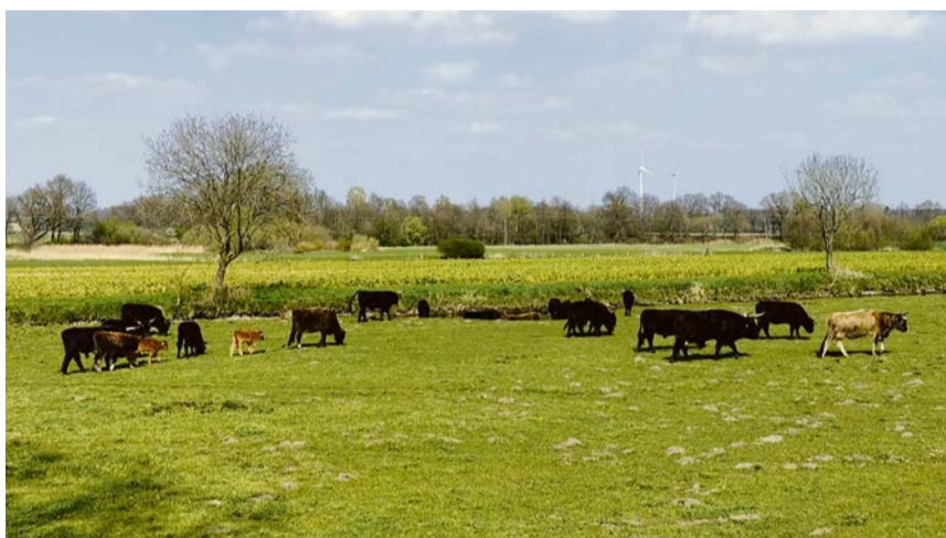
Die Heckrinder leben frei auf großen Flächen und genießen ein artgerechtes, erfülltes Leben. Um das natürliche Gleichgewicht zu wahren, wird die Größe der Herden angepasst. Das daraus resultierende Fleisch kann jetzt auch im Naturparkhaus in Gläsern erworben werden.

Nächster Abholtermin ist Herbst/Winter 2026. Interessierte können sich per E-Mail unter steverau@olfen.de anmelden. Die Abnahme ist mit der Interessensbekundung nicht verpflichtend.