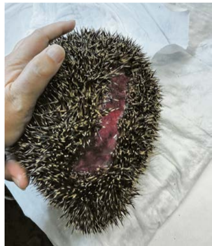
Immer häufiger werden Igel durch Maschinen schwer verletzt.

„Igel sind keine Fluchttiere. Sie rollen sich zusammen und werden dann übel zugerichtet. Gartenmaschinen wie Freischneider, elektr-