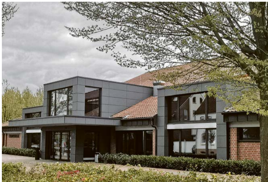
Für Olfener Vereine wird die Stadhallenmiete günstiger.