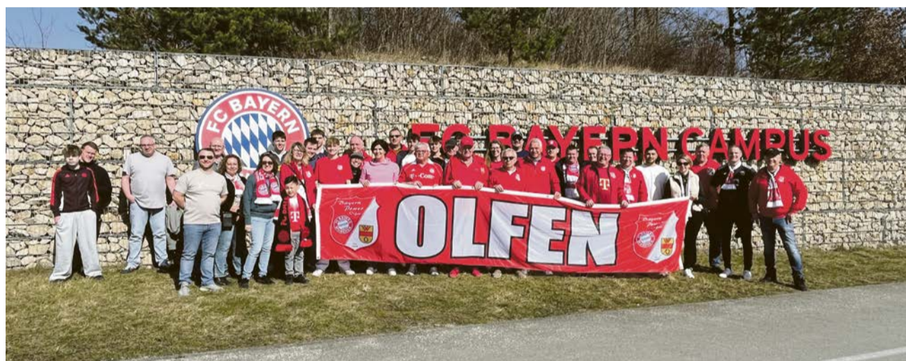
Auf nach München hieß es auch in diesem Jahr für den Olfener Fußball-Fan-Club „Bayern-Power“.

Auf die Erfahrung dieser Männer gänzlich zu verzichten, ist nicht im Sinne der Olfener und Vinnumer Wehr. „Wir freuen uns darauf, auch weiter eure Unterstützung zu erhalten und den nachfolgenden Generationen so den Einstieg und das Durchhalten in diesem so wichtigen Ehrenamt zu erleichtern“, so die Vertreter der Stadt und der Feuerwehr.