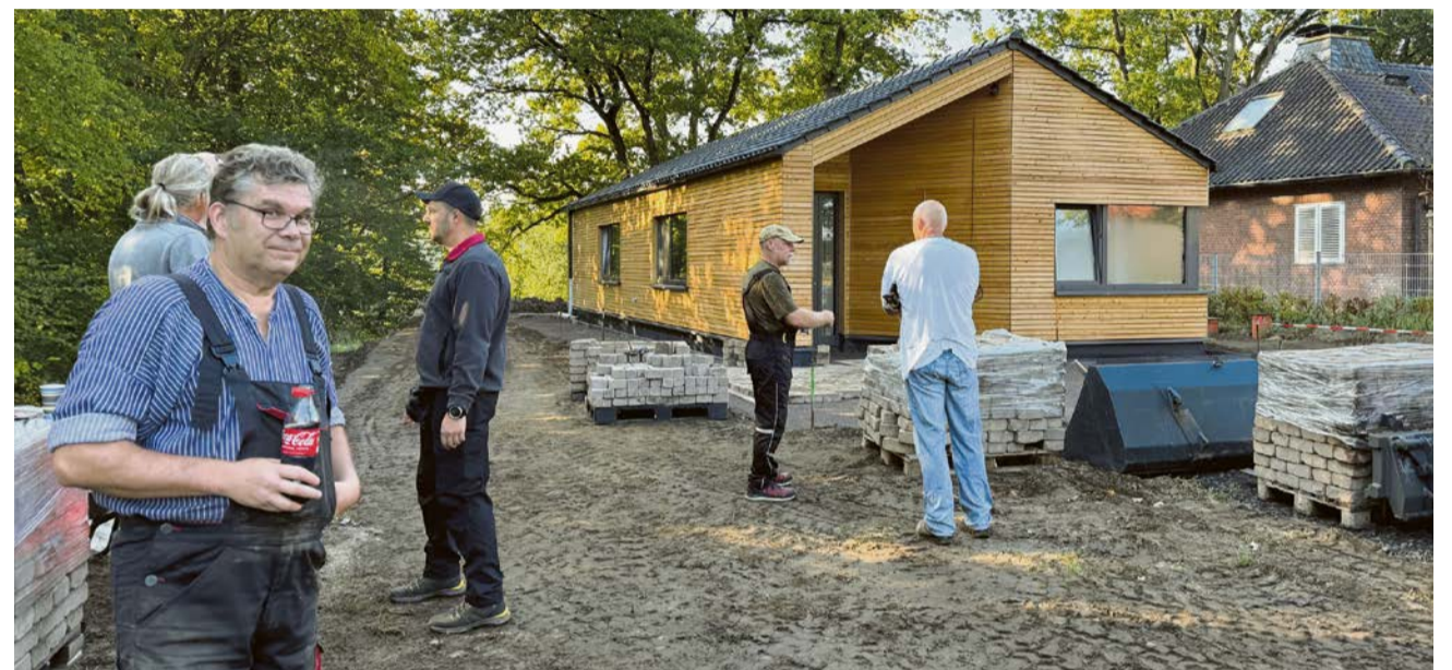
Während des Baus des Vereinsheimes haben die Mitglieder tatkräftig angefasst.