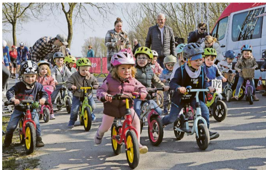
Das Lauf radrennen war nicht nur für die Kleinen ein Highlight. Sie zeigten Ehrgeiz und Leidenschaft und wurden anschließend alle mit einem Geschenk belohnt.