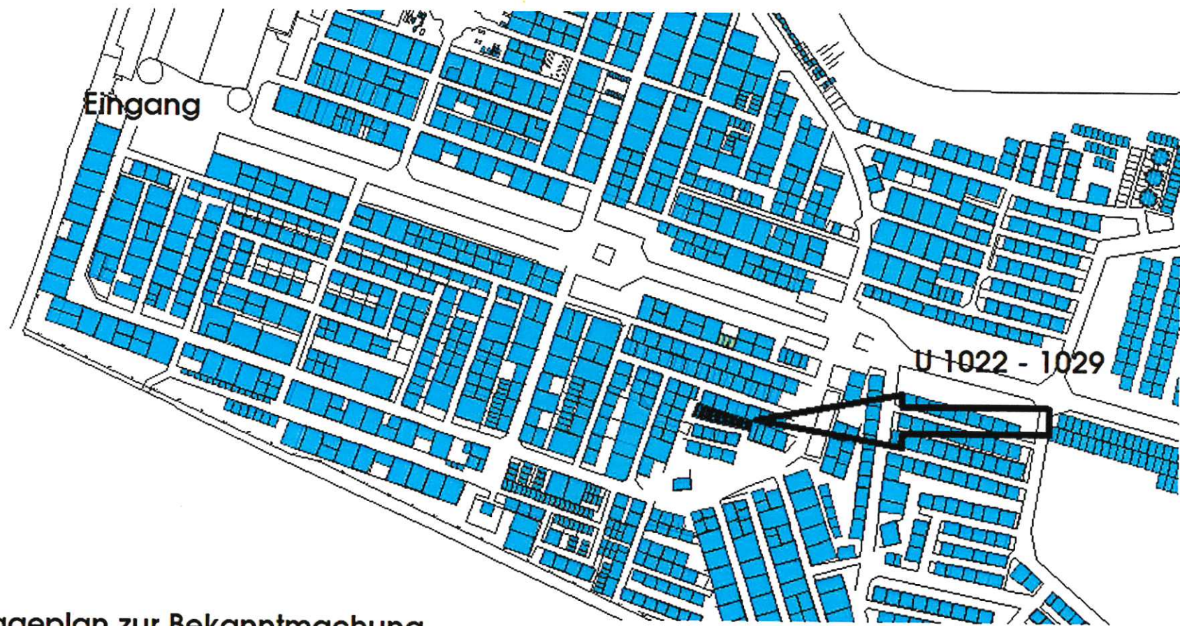
Lageplan zur Bekanntmachung "Einebenen von Urnenreihengräbern" auf dem städtischen Friedhof in Olfen.