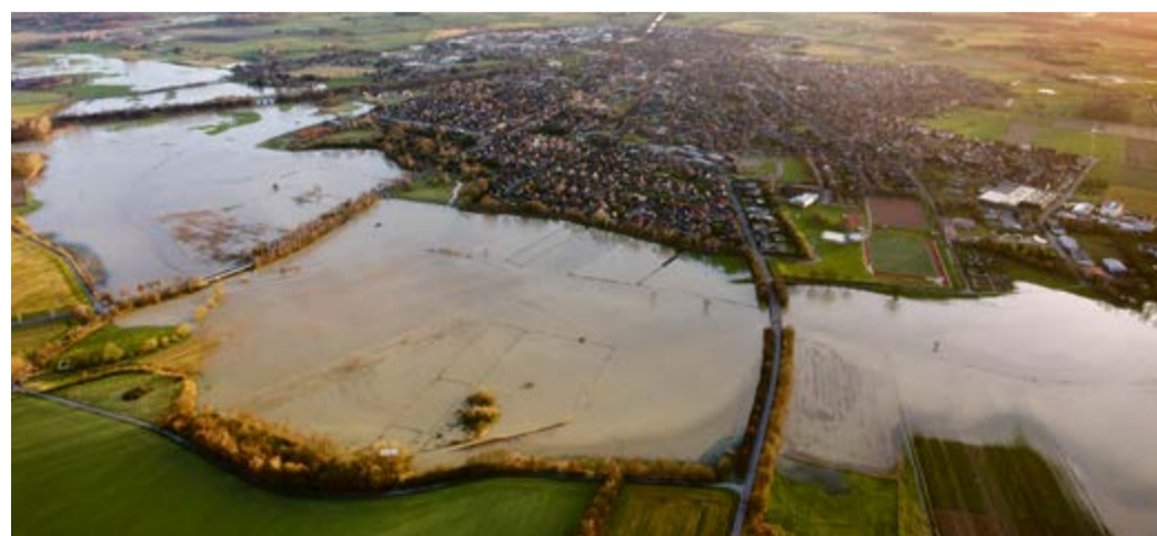
Eine Luftaufnahme vom Hochwasser im Januar 2008.