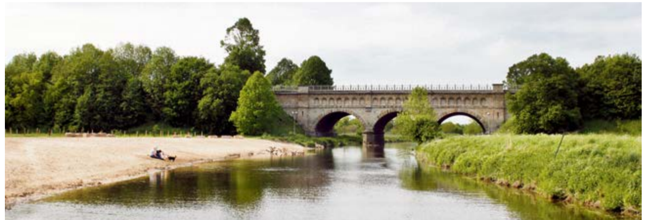
In Olfen kann fast an jedem Standort geheiratet werden. Der Flussstrand an der Dreibogenbrücke gehört dazu.