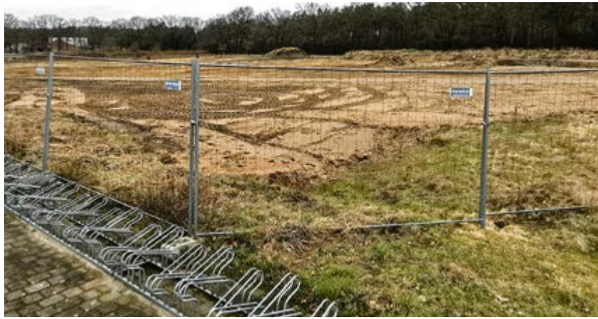
Nach Beendigung der Ausgrabungsarbeiten wurde jetzt die Fläche planiert.

Die Archäologische Arbeit ist getan, und nun hat der Eigentümer und spätere Betreiber des Stellplatzes die Einplanungen der gesamten Sandfläche vorgenommen. „Nun kann die Politik in