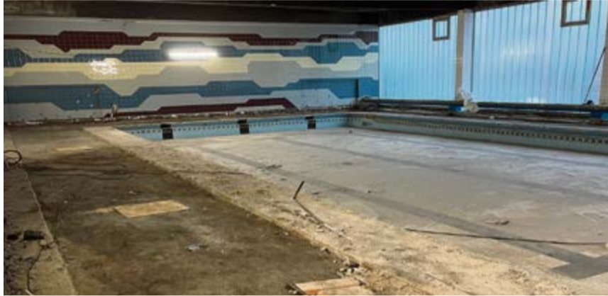
Die Rückbauarbeiten im Hallenbad haben begonnen. Weiter geht es mit der Geest-Turnhalle.