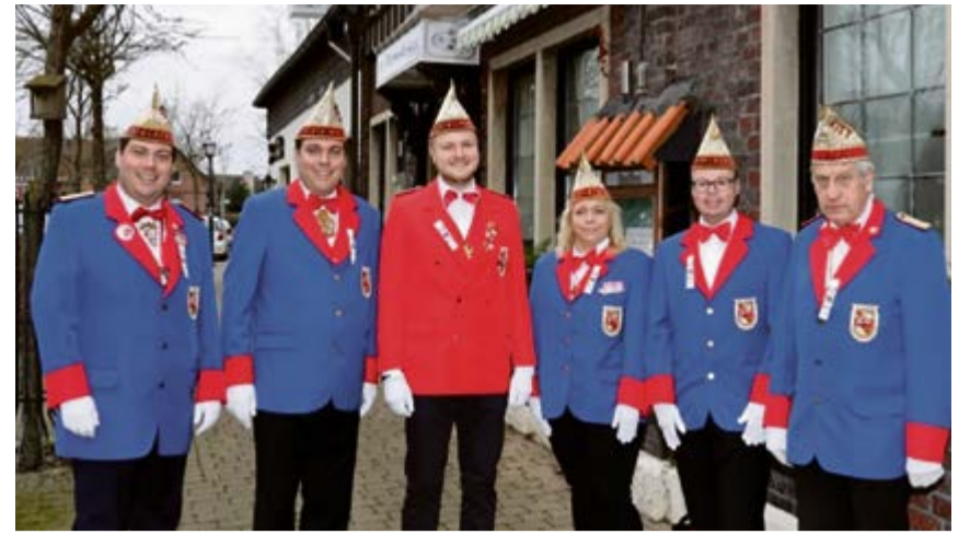
Die Plakettenverkäufer feiern 50-jähriges Bestehen und suchen dringend Verstärkung.

unterstützen, ihn bei seinen Umzügen durch ihr buntes Bild beleben. Die Bedenken, nicht genügend begeisterte junge Männer für die Garde gewinnen zu können, erwiesen sich als völlig unbegründet: Schon in kürzester Zeit waren durch viele Einzelgespräche noch weitere 21 Gardisten gewonnen, und jede