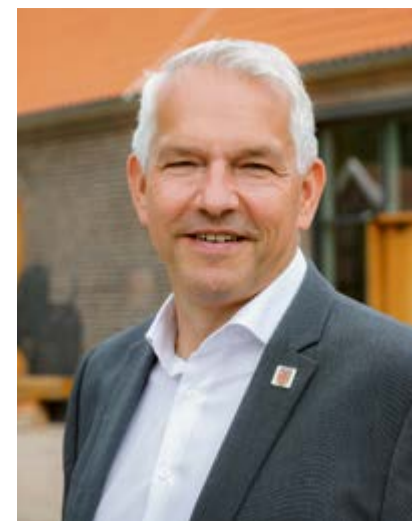
Bürgermeister Wilhelm Sendermann

Anstehende Investitionen müssten geprüft werden, um auch weiterhin schuldenfrei bleiben zu können. Neben den Ausgaben müsse man auch die Einnah-