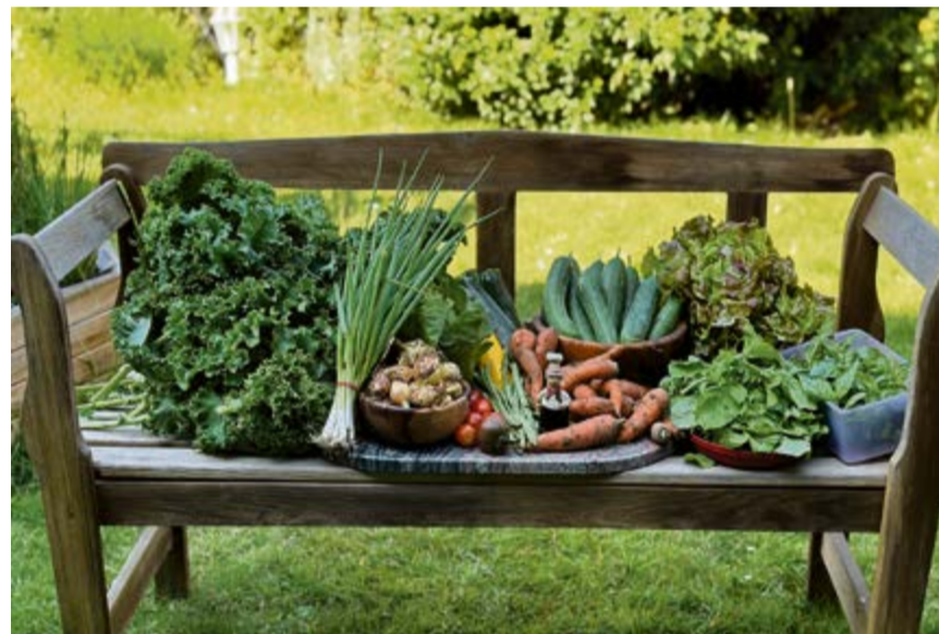
Die SoLaWi Olfen baut regionales Gemüse an und ist mit ihrem ehrenamtlichen Engagement eine von drei Preisträgern des Olfener Umweltpreises 2023.

Das Preisgeld in Höhe von 1.000 Euro, das in jedem Jahr von der GENREO zur Verfügung gestellt wird, wird als Dank und Anerkennung zu gleichen Teilen unter den Preisträgern aufgeteilt. Die offizielle Preisverleihung des Umweltpreises findet am 19. März vor der nächsten Sitzung des Bau- und Umweltausschusses statt.