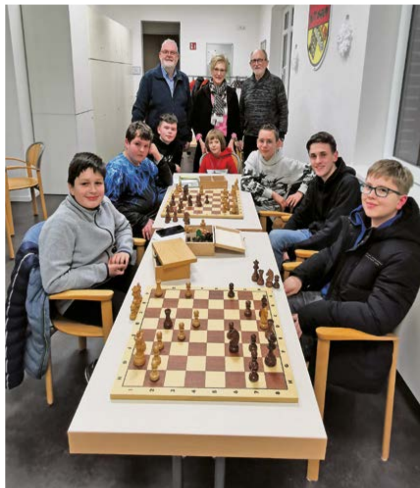
Die Schachfreunde Olfen 1975 jeden Alters treffen sich in den Räumen des KITT-Vereins im Leohaus immer donnerstags zum Training.

Danach können sich die Erwachsenen ab 19.00 Uhr verabreden, um gegeneinander zu spielen.