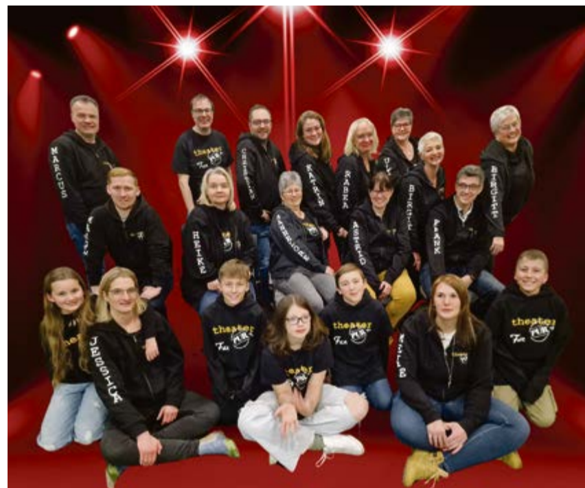
Schauspiel ist ihre Leidenschaft: Das Ensemble von „theaterPUR-olfen“.