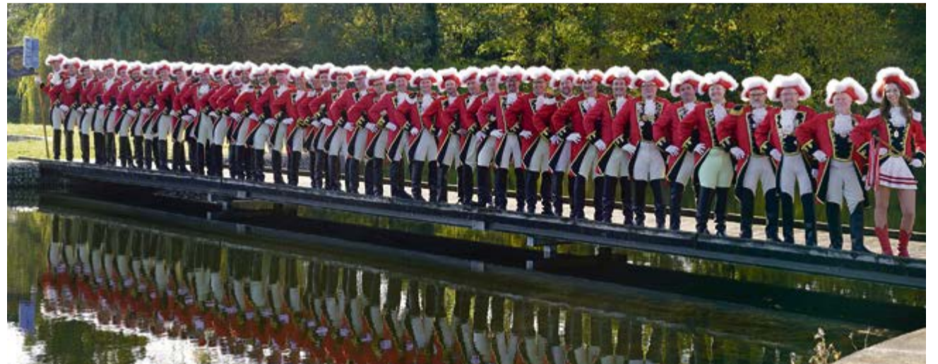
Die Prinzengarde besteht seit 1949 und feiert 75-jähriges Bestehen. Wie immer wählt die Prinzengarde das Funkenmariechen der Session.

Die Aufgabe der Garde war ziemlich schnell umrissen: Sie sollten den Prinzen