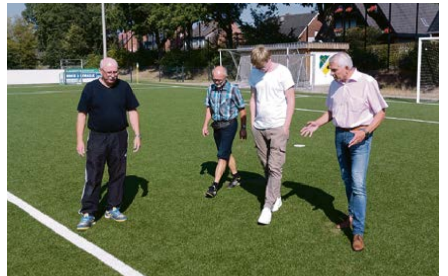
Im Sommer haben SuS und Stadt Olfen den Kunstrasen eingehend besichtigt.

Bewerbungen richten Sie bitte an: Stadt Olfen, Der Bürgermeister, Kirchstr. 5, 59399 Olfen oder per E-Mail an bewerbung@olfen.de