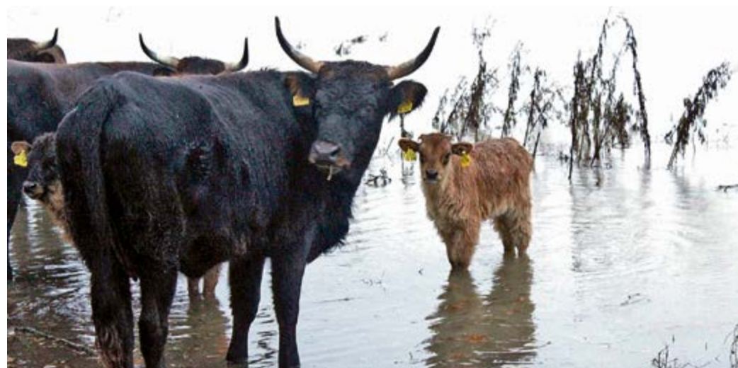
Hochwasser 2007: Schon die jungen Heckrinder lernten mit Hochwasser umzugehen.

„Wenn man der Natur freien Lauf lässt, verändern sich die Flussläufe bei Hochwasser auf ganz natürliche Art. Das tut dem Leben in unseren Auen besonders nach den trockenen Jahren nachhaltig gut“, resümiert Bürgermeister Sendermann.